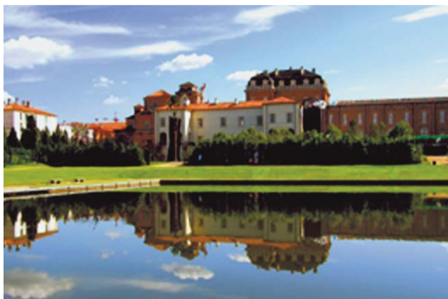
Venaria Reale (TO), la Reggia d'Italia con i suoi giardini